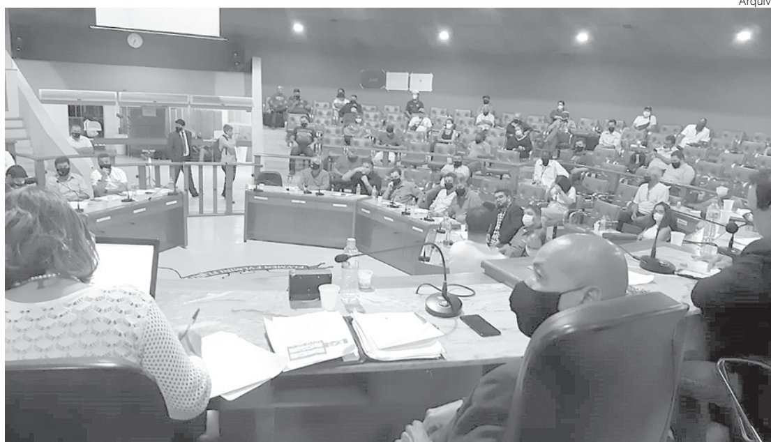
Vereadores aprovaram criação da Secretaria de Ordem Pública de Volta Redonda