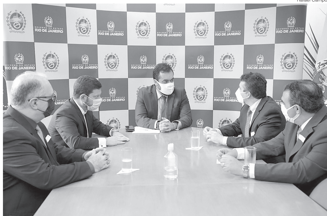
Presidente da Nissan no Brasil informa ao governador Claudio Castro sobre investimentos em Resende

Para começar o segundo turno no prazo previsto, a Nissan vai iniciar a seleção e a contratação dos novos funcionários já neste mês de outubro. Com isso, a empresa vai reforçar a produção para atender a demanda pelo Novo Kicks, lançado em março, tanto no mercado interno quanto em outros países, com a exportação do modelo brasileiro. Atualmente, há 2 mil funcionários trabalhando na fábrica de Resende.